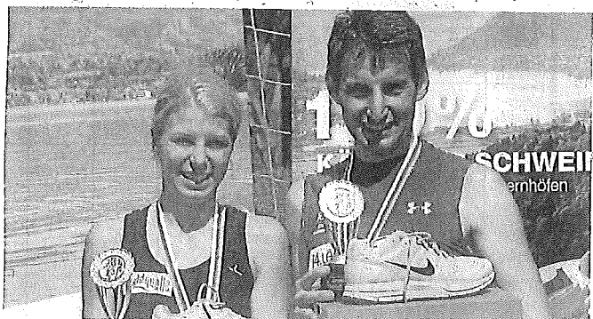
Plieschnig und Eberdorfer waren die Schnellsten beim Längseelauf

Für die Organisation des Laufes zeichnete die Dorfsportgemeinschaft Drasendorf unter der Leitung von Ilse Schöffmann verantwortlich. WILFRIED GEBENETER